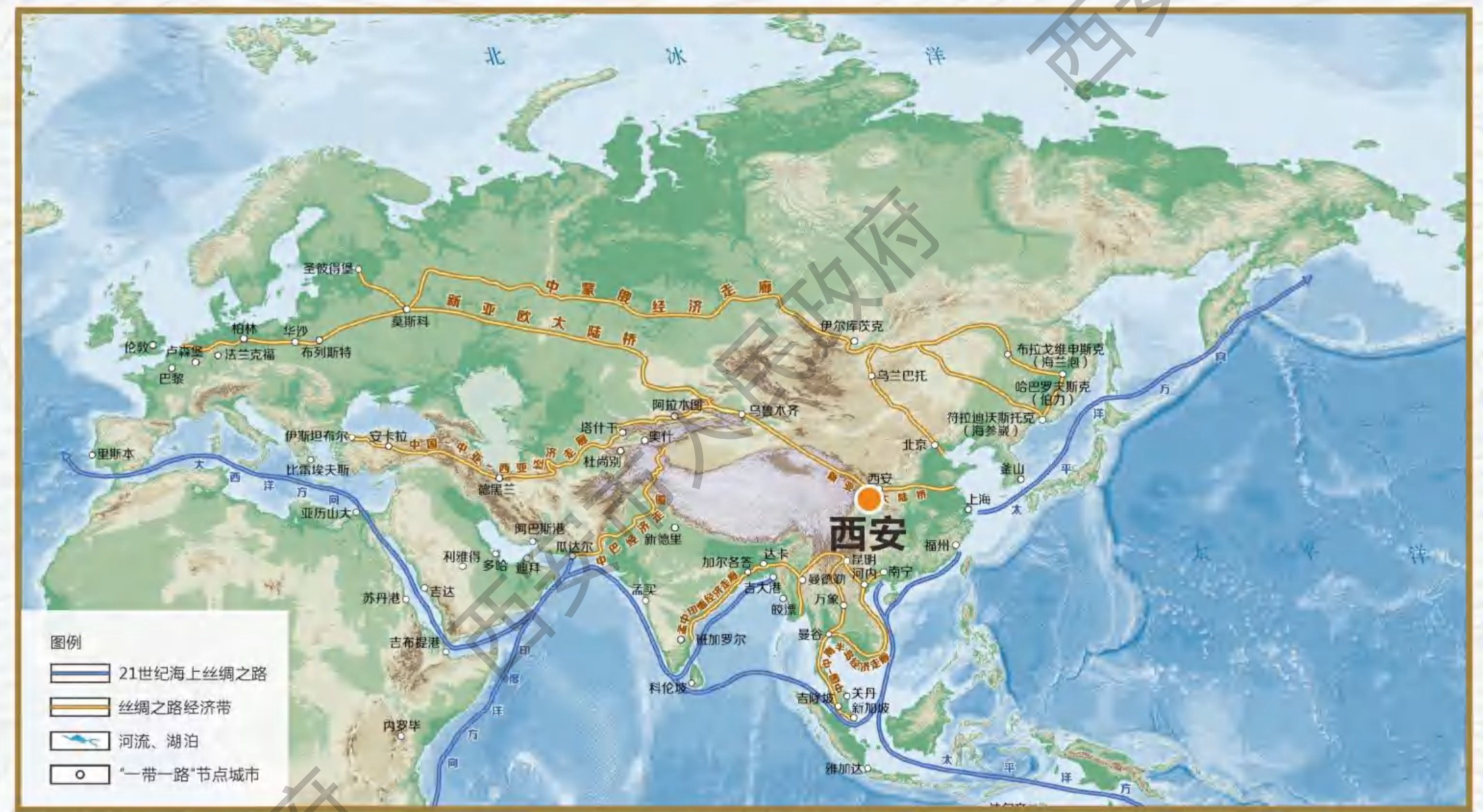
西安在“一带一路”经济带的地位