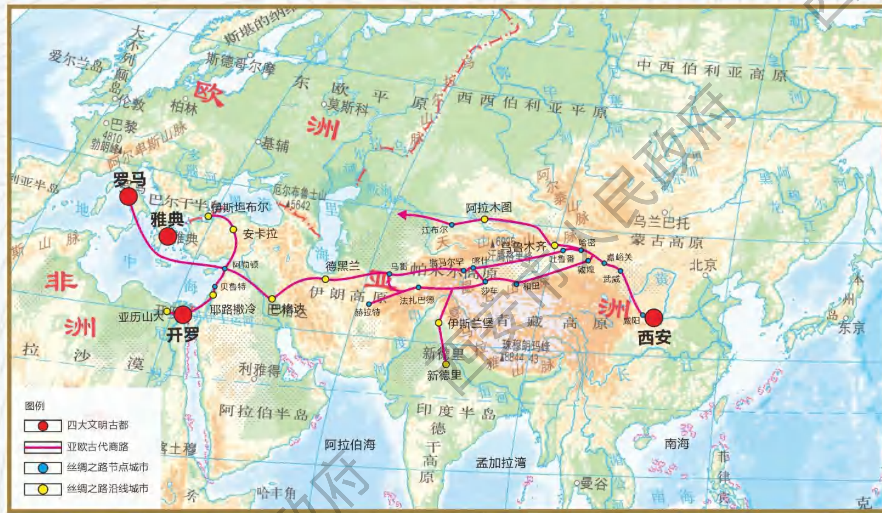
西安在世界古都的地位